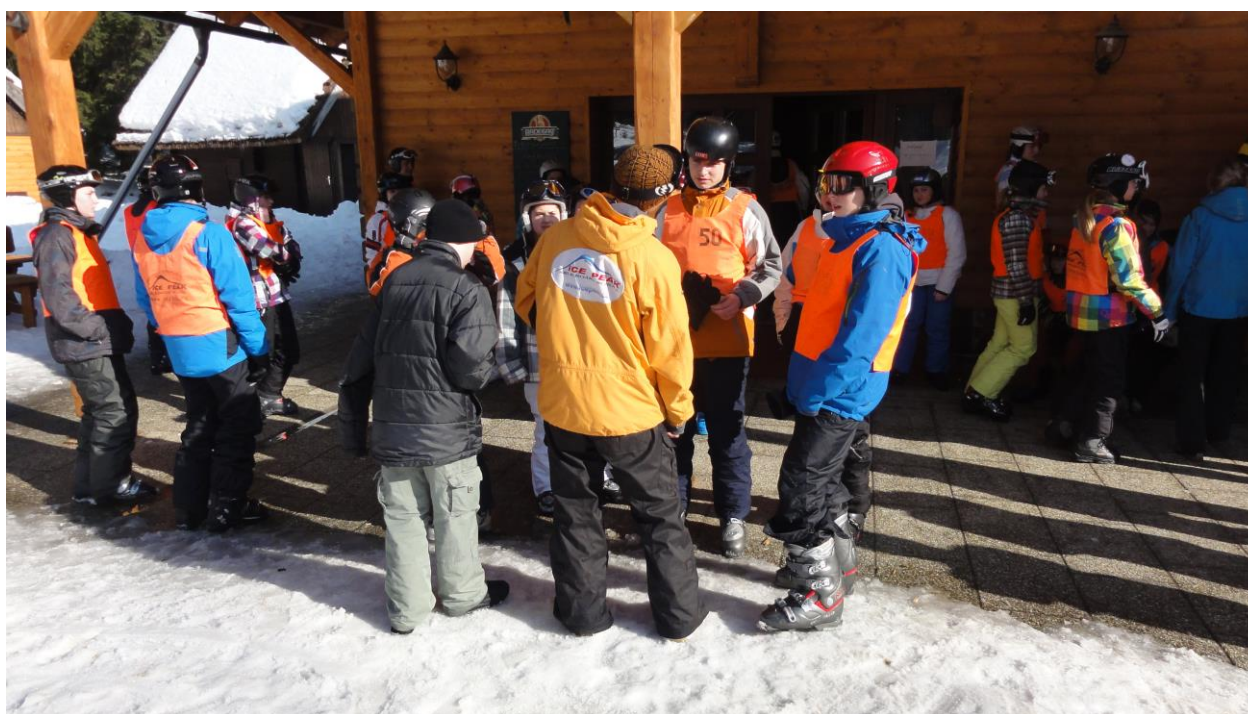
Z lyžařského výcviku