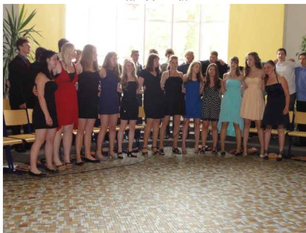
Závěr školního roku- vyřazení žáků 9.tříd.