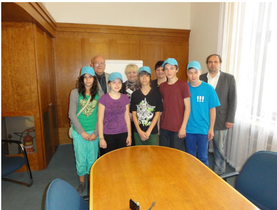
Návštěva žáků partnerských škol na ostravské radnici.