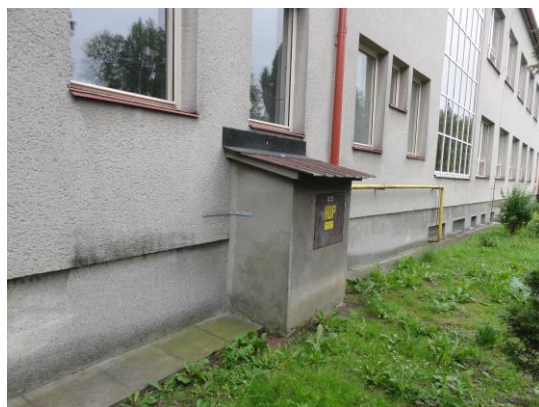
Před rekonstrukcí školy