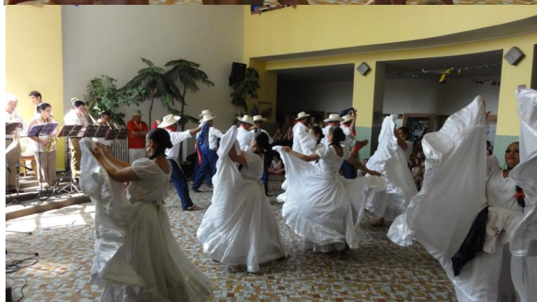
V rámci festivalu Františka Lýska vystoupila ve škole venezuelská folklorní skupina tanečníků.