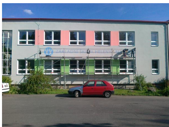
Před dokončením zateplení a výměny oken