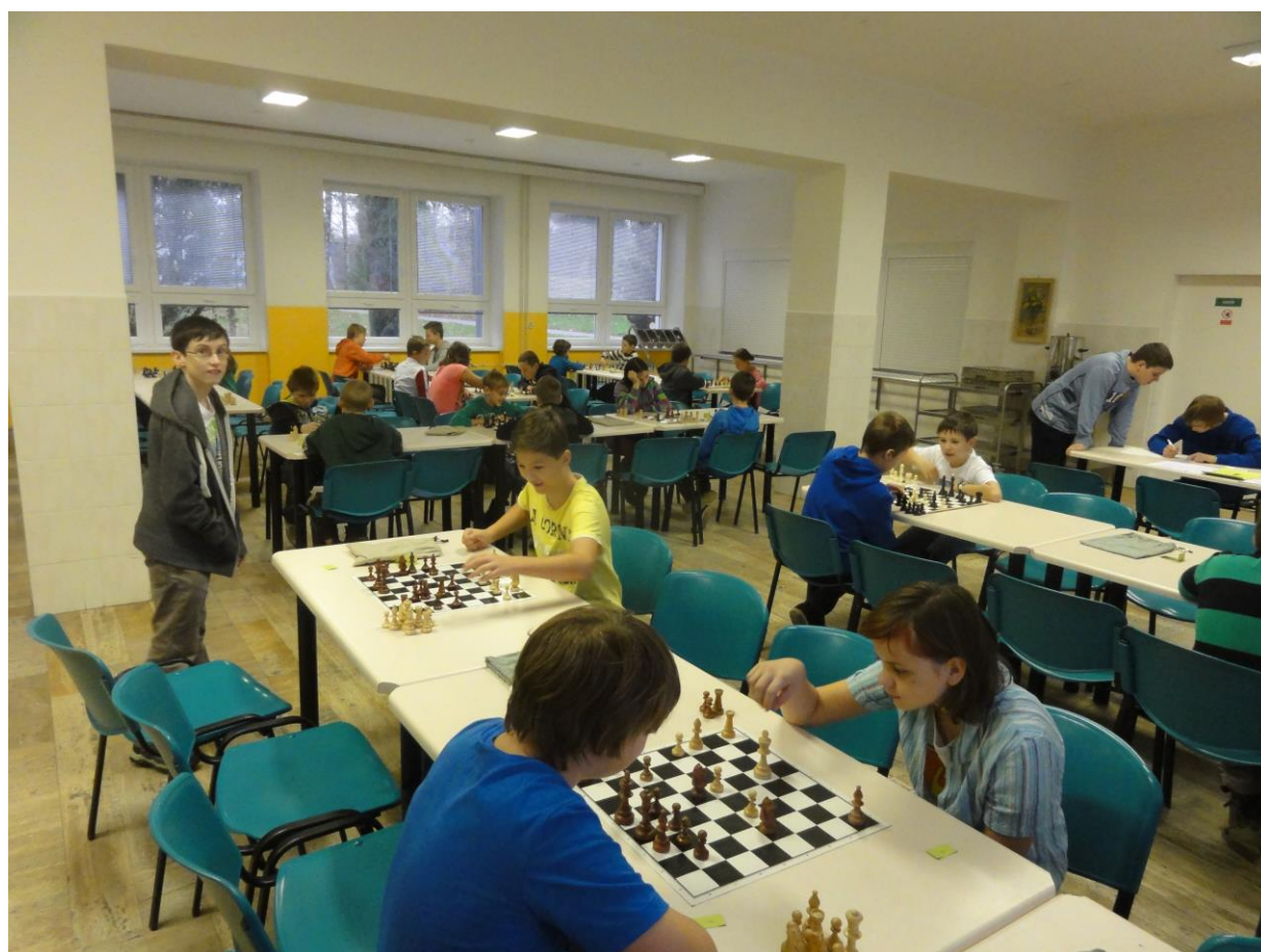
Šachový turnaj o přeborníka školy