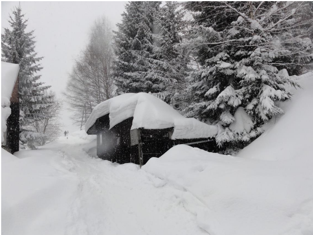
Škola pořádá pravidelně každým rokem lyžařské kurzy v Beskydech nebo Jeseníkách-ilustrační foto.