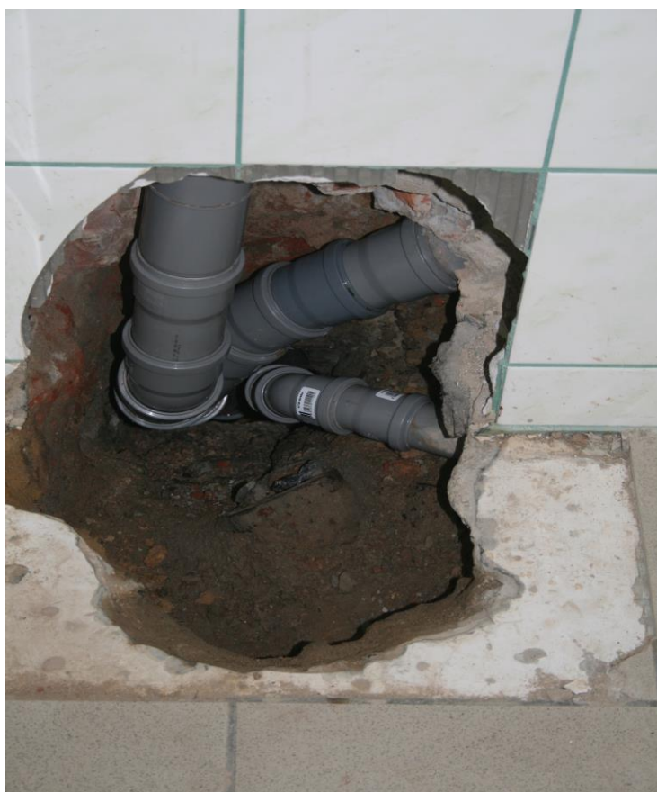
Občas se stane nějaká havárie a pak se s opravou musíme umět „poprat“.