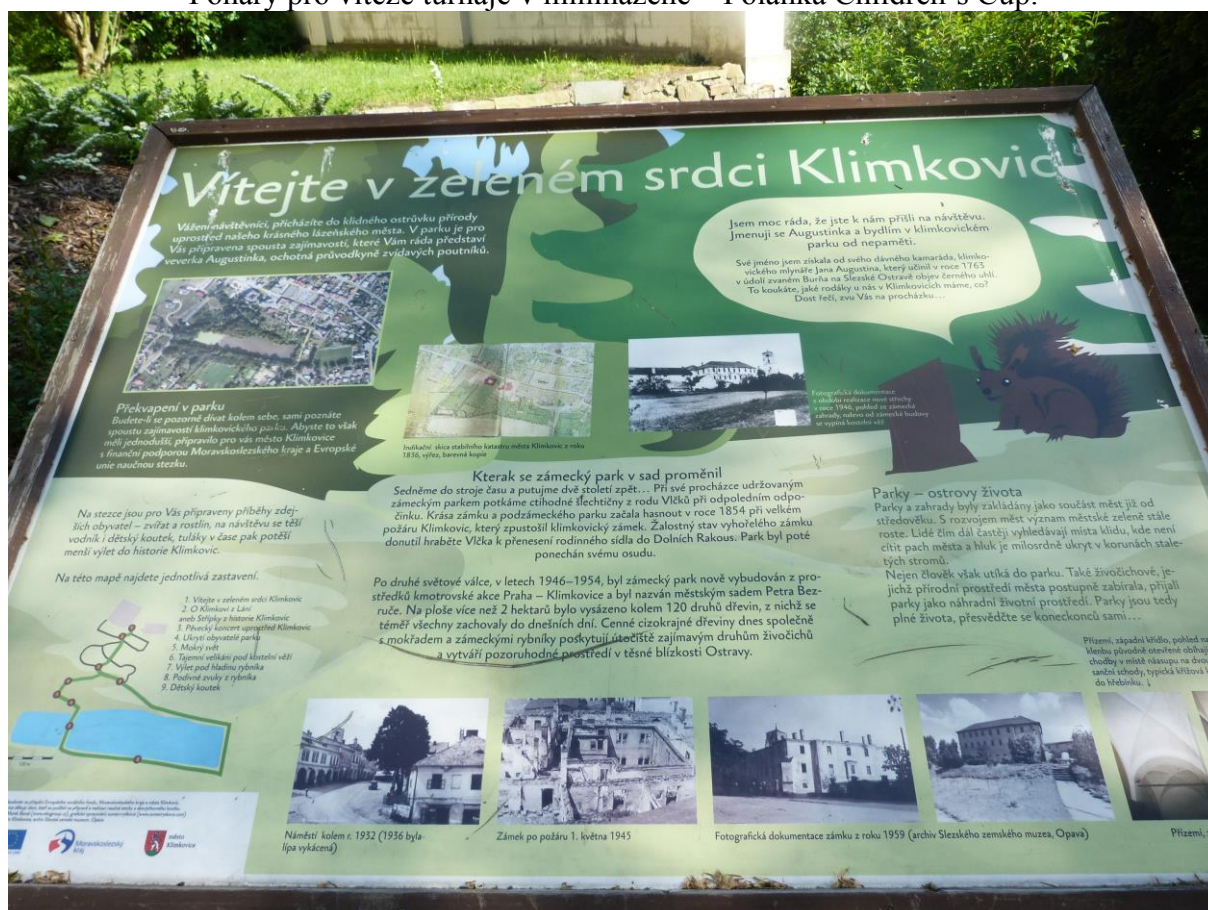
Návštěva Klimkovic společně se žáky partnerské školy Prokopa Diviše ze Znojma-Přímětíc.