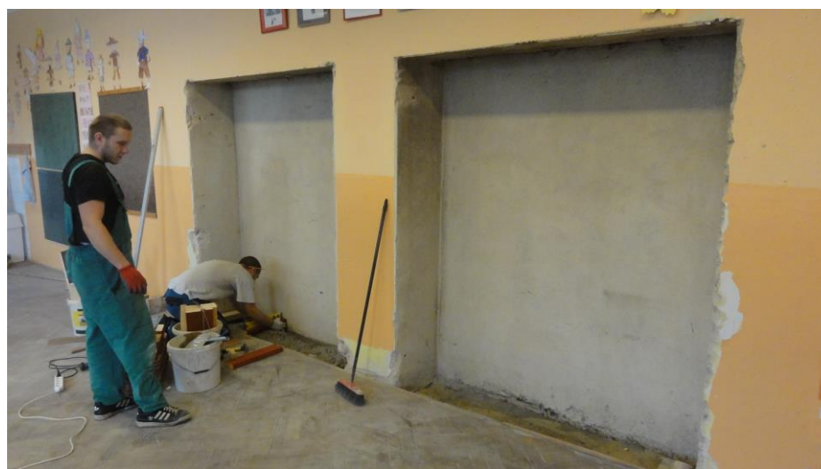
Výměna zabudovaných skříní ve třídách.