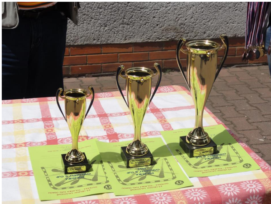
Poháry pro vítěze turnaje v miniházené – Polanka Children's Cup.