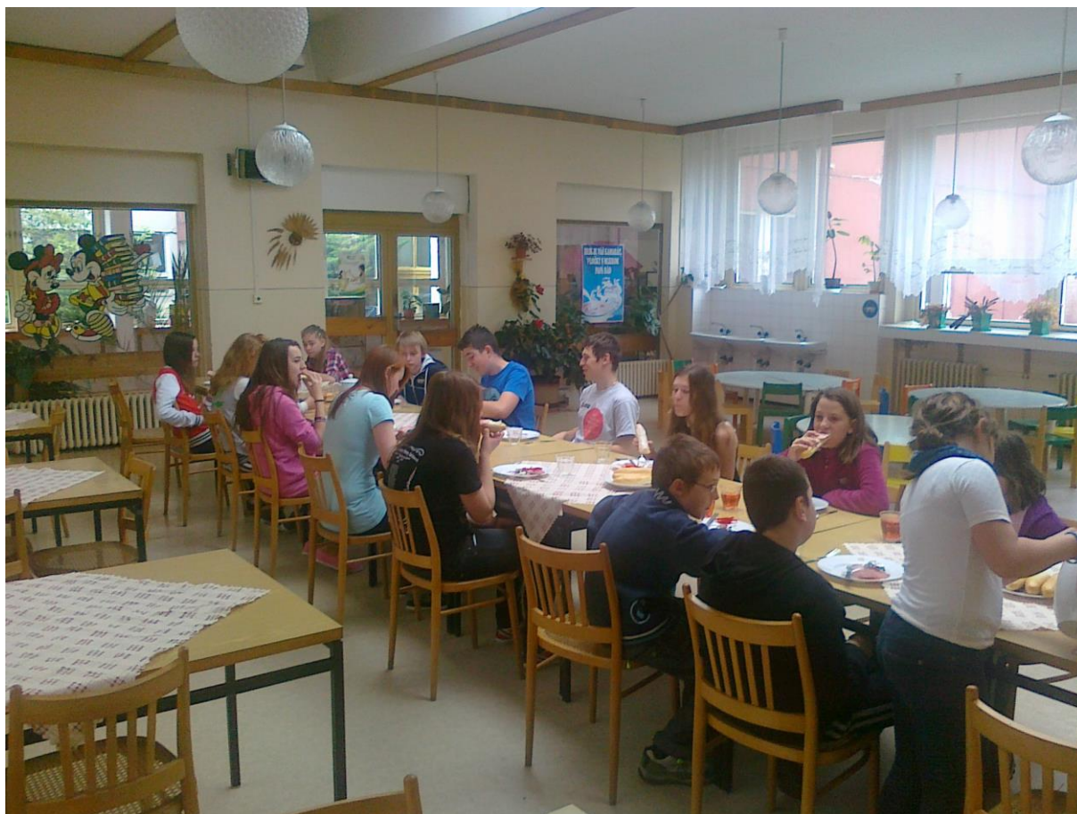
V jídelně v ZŠ Starozagorská 8 v Košicích.