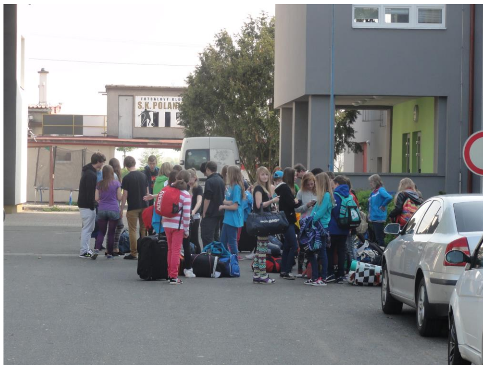
Žáci z Košic přijeli na výměnný pobyt