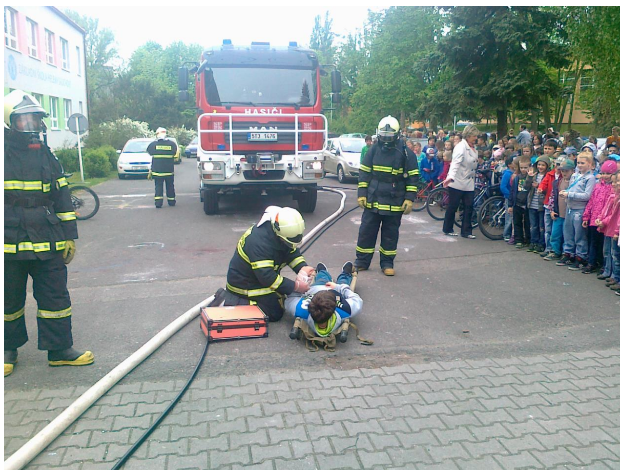
Evakuace školy – cvičení s hasiči z Polanky nad Odrou.