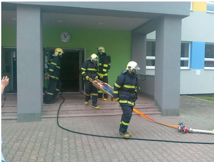
Hasičské cvičení – záchrana raněného.