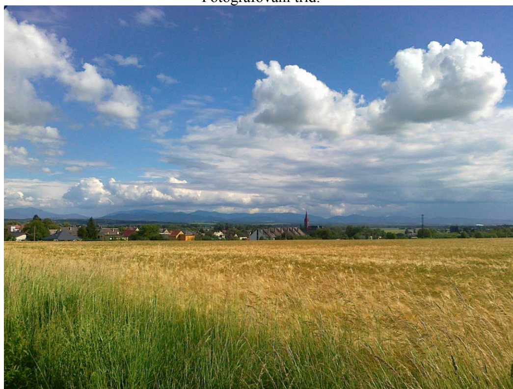
Okolí Polanka nad Odrou – vhodné možnosti na vycházky pro žáky školy.