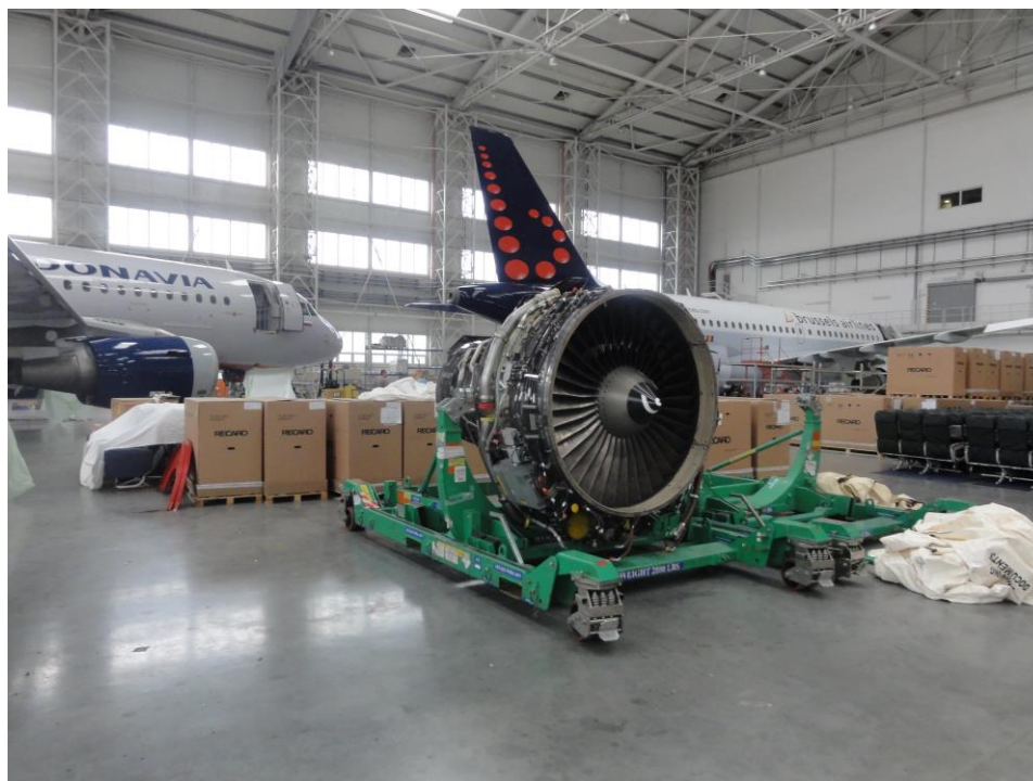
Návštěva letiště v Mošnově a exkurze do Job Air- opravy letadel.