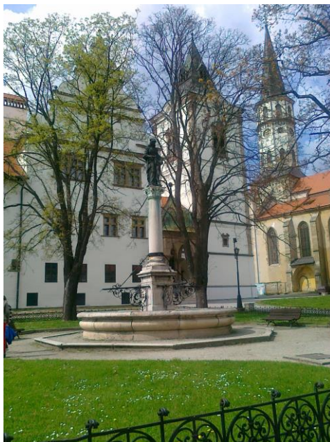
Levoča – návštěva v rámci projektu – „Poznávejme přátelé ze Slovenska“